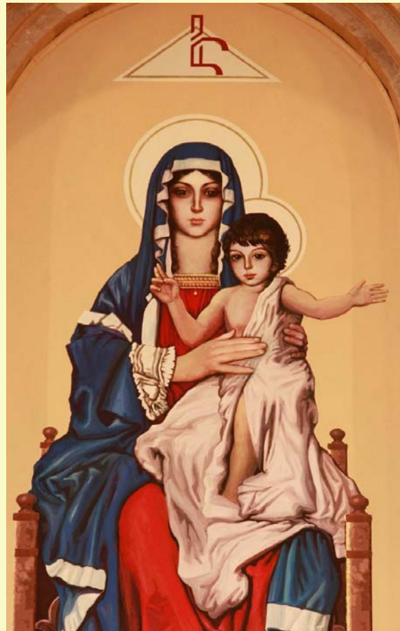
Blessed Virgin Mary with baby Jesus, painting at St. Mary Church Altar

Isaiah 9:8-19 2 Corinthians 1:1-11 Mark 4:35-40.